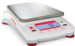
Navigator XL天平 (LCD显示屏)