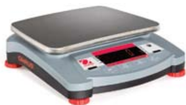
Navigator XT天平 (LED显示屏)