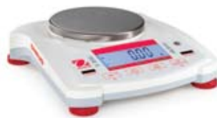
Navigator天平 (圆秤盘、LCD显示屏)