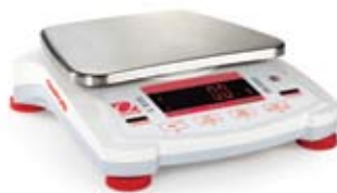
Navigator天平 (方秤盘、LED显示屏)